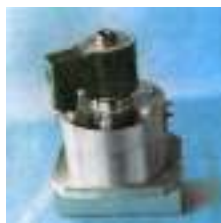
VEM 29; 30