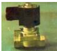
VEM 10; 43; 45