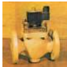
VEM 32; 33