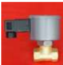
VEM 17; 19; 20